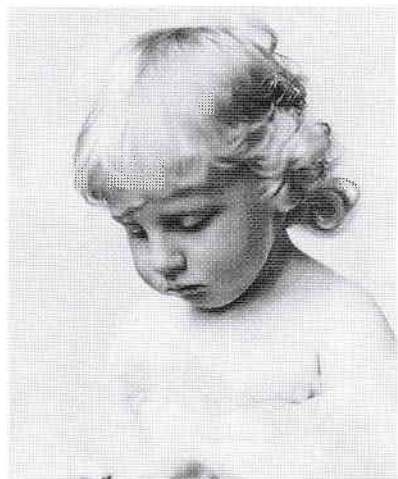
Principele Nicolae, cca 1904.

În același spirit, Regele Carol I scria de la București, la 29 decembrie 1902/1 ianuarie 1903, fratelui său Leopold: „Nașterea este așteptată pentru luna iulie, firește, la Sinaia, în noua casă” 47 . După ce Marea Ducesa Maria Alexandrovna, mama Principesei Maria, asistă la primele trei nașteri, Regele Carol I îi împărtășește fratelui său temerile legate de vizita acesteia, la Sinaia: „Să sperăm că n-o să mai vină din nou mama ei. Nu mai este binevenită pentru nimeni, nici măcar pentru propria ei fiică. În ceea ce privește vizita surorii ei n-am mai auzit nimic și evit orice întrebare în privința asta” 48 . La rândul său, Principele Ferdinand îi scria de la Sinaia, la 10/23 iunie 1903, fratelui său, Principele Carlo: „Aici, în rest, toate sunt bune. Săptămâna viitoare așteptăm o sporire a numărului de membri ai familiei. Să dea Dumnezeu să fie băiat” 49 .