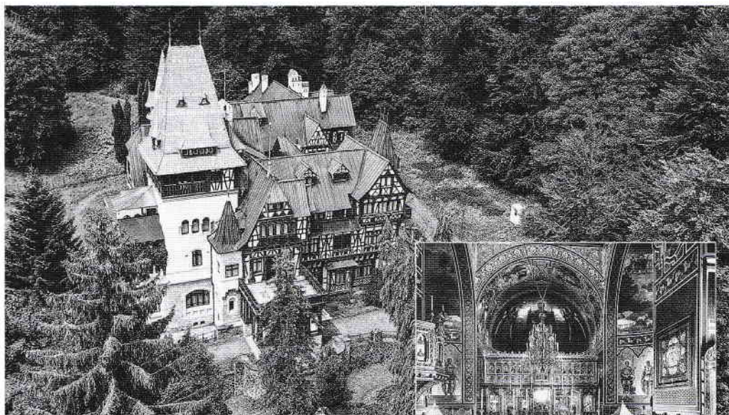
Castelul Pelișor, vedere panoramică

Peste câteva zile, la 6/19 noiembrie 1902, Regele Carol I justifica amânarea, într-o scrisoare adresată Principelui Leopold: „[...] Construcțiile fac progrese rapide; castelul mic este aproape mobilat, dar abia anul viitor se vor putea muta în el, căci Nando și Missy vor pleca în curând la Cotroceni” 36 . La rândul său, Principele Ferdinand îl informează și pe Principele Leopold, prin scrisoarea din 20 noiembrie 1902,